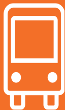
Route FF2 Express US 36 Stations Effective: 7 June 2026 Map Revised: 7 June 2026