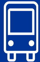
Route FF1 All US 36 Stations Effective: 4 January 2026 Map Revised: 4 January 2026