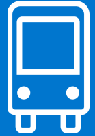
Route DASH Boulder/Lafayette via Louisville Effective: 25 May 2025 Map Revised: 25 May 2025