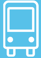
Route AB1 Denver Airport/Downtown Boulder (DBS) Effective: 4 January 2026 Map Revised: 4 January 2026