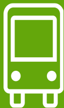
Route 120X Thornton/Wagon Rd Express Effective: 4 January 2026 Map Revised: 4 January 2026